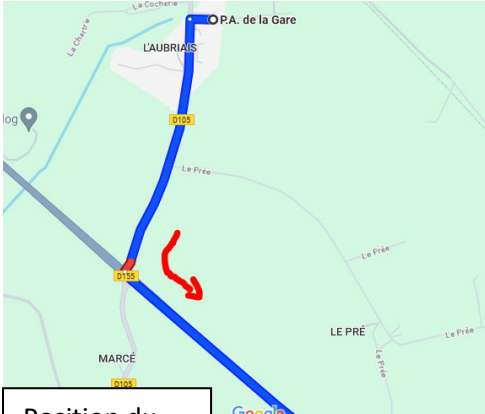
Position du photographe