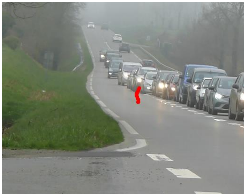
Figure 1 - File de 26 véhicules - blocage D155

A partir du 18 ème véhicule on est obligé, soit de rouler sur les zebra (interdit...) soit de bloquer la D155 en empiétant dessus.